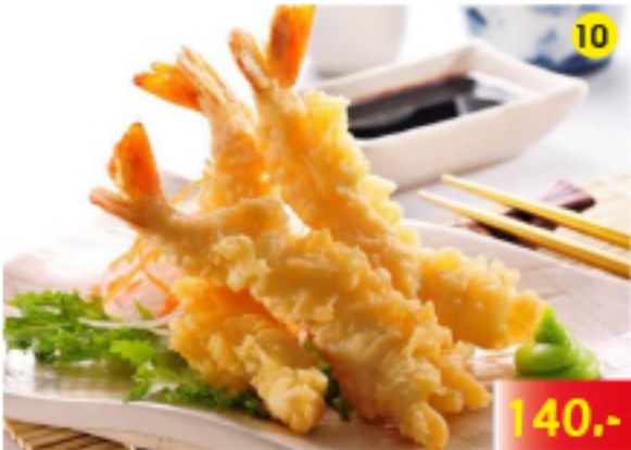
กุ้งชุบแป้งทอด Shrimps Tempura Shrimps Tempura