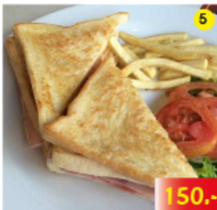
แฮม แซนวิช & เฟรนช์ฟราย Ham Sandwich with French Fries Schinken Sandwich