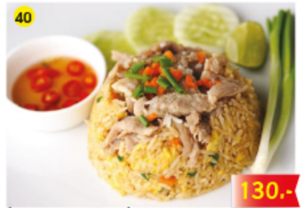
40 ข้าวผัดหมู / ไก่ / เนื้อ Kau Phad : Fried Rice with Pork, Chicken or Beef Gebratener Reis mit Schwein, Huhn oder Rind 130.-