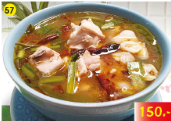
57 ต้มยำไก่ / ซิวฟู้ด Tom Yum Soup, Chicken or Seafood "Tom Yum" Suppe mit Huhn oder Meeresfrüchten