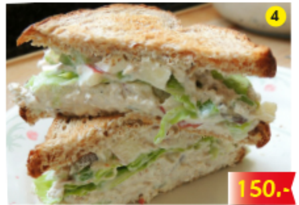
ทูน่า แซนวิช Tuna Sandwich Thunfisch