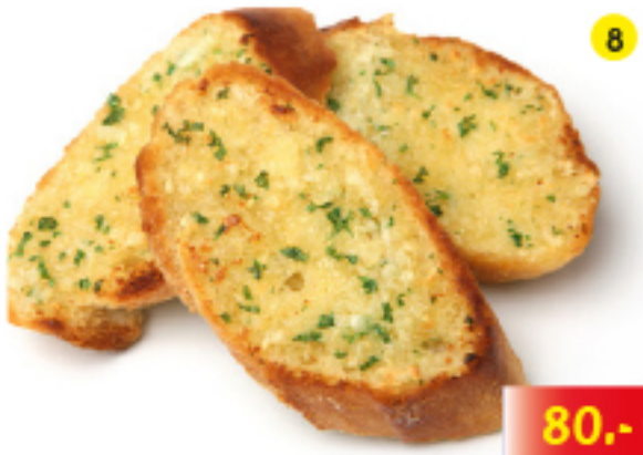
ขนมปังกระเทียม Garlic Bread Knoblauchbrot