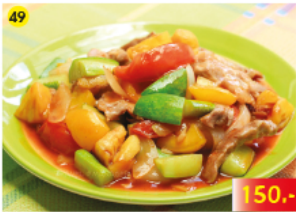
49 ผัดเปรี้ยวหวานไก่ / เนื้อ / หมู Sweet and Sour Chicken, Beef or Pork Huhn, Rind oder Schweinefleisch Süß-Sauer