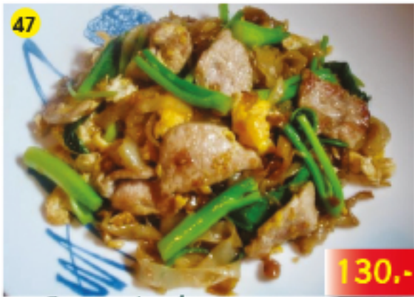
47 ผัดซีอิ้วหมู / ไก่ / เนื้อ Pad Siyu : Fried Noodles with Pork, Chicken or Beef Pad Siyu : Gebratene breite Nudeln mit Schwein, Huhn oder Rindfleisch