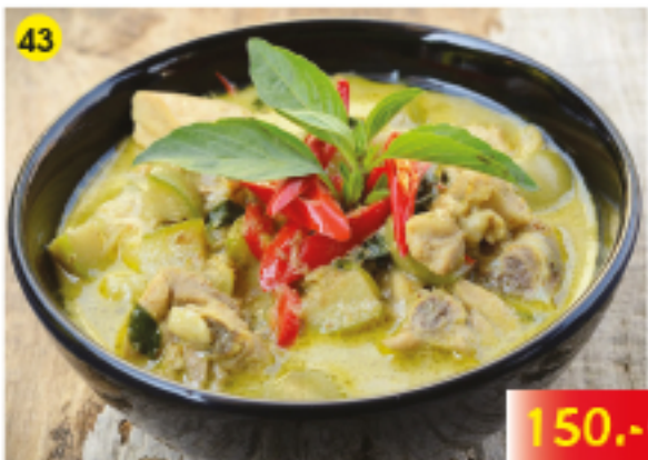
43 แกงเขียวหวาน ไก่ / เนื้อ / หมู Green Curry with Chicken, Beef or Pork Grünes Curry mit gebratenem Huhn, Rind oder Schwein 150.-