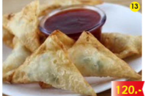
เกี๊ยวทอด Thai Fried Wonton Gebratene Wonton