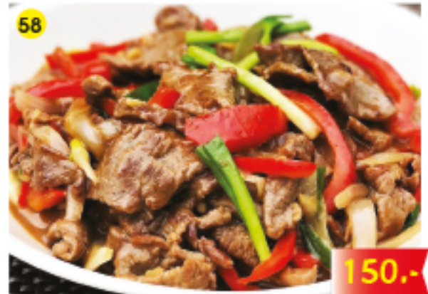
58 เนื้อผัดน้ำมันหอย Fried Beef in Oyster Sauce Gebratenes Rindfleisch in Austernsosse