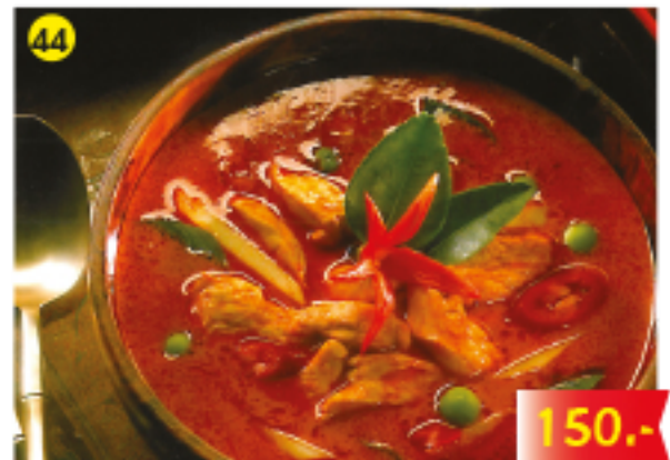
44 ผัดเค็รียงแกงแดง ไก่ / เนื้อ / หมู Red Curry with Fried Chicken, Beef or Pork Rotes Curry mit gebratenem Huhn, Rind oder Schwein 150.-