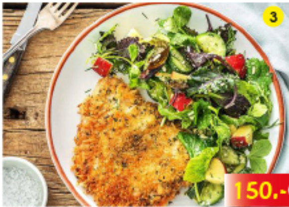
หมูขนิษฐา ผักสลัด Schnitzel and Salad Schnitzel und Salat