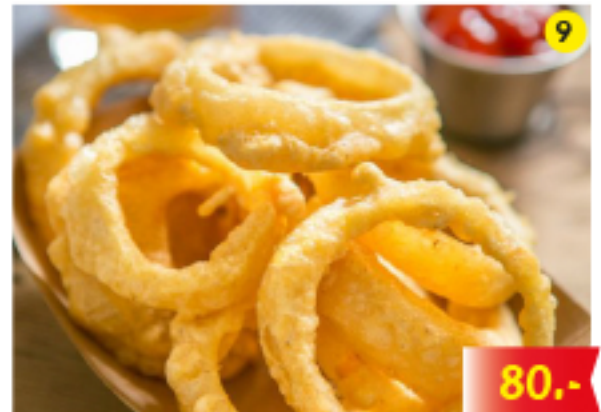
หอมทอด Onion Rings Zwiebelringe