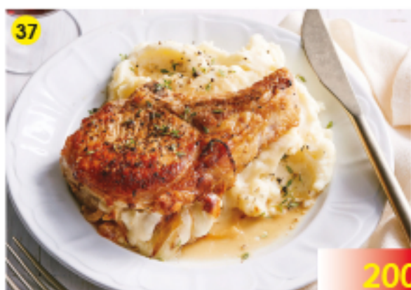
เนื้อหมู, น้ำเกรวี่และมันฝรั่งบด Pork Chops, Gravy and Mashed Potatoes Schweinekotelett, Bratensosse und Kartoffelpüree