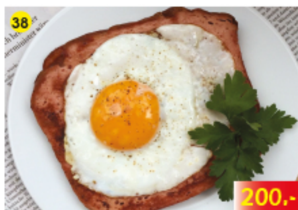
มีทโลฟ, ไข่ดาว 2 ฟอง และมันฝรั่งทอด Slice of Meatloaf, 2 Fried Eggs and Fried Potatoes Scheibe gebackener Fleischkäse mit 2 Spiegeleiern und Bratkartoffeln