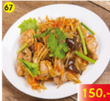
67 ไก่ผัดขิง Gai Pad King Fried Chicken with Fresh Ginger Gebratenes Hühnerfleisch mit Ingwer