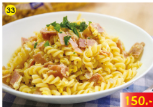
ปะหมี่แฮมเยอรมัน, ปะหมี่ผัดไข่แฮม German Ham Noodles, Fried Noodles with Ham&Egg Schinkennudeln mit Ei