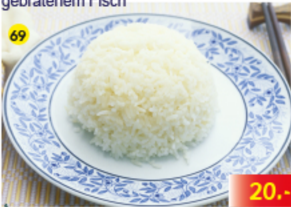
69 ขาวหอมมะลิ Side order Jasmine Rice Portion Thai Jasmin Reis

Our Thai Chef cooks authentic and delicious Thai food from all provinces. Please do not hesitate to ask for your favorite Thai dish.