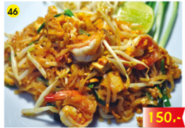
46 ผัดไทยซีฟู้ด Pad Thai : Fried Noodles with Seafood Gebratene Nudeln mit Meeresfrüchten