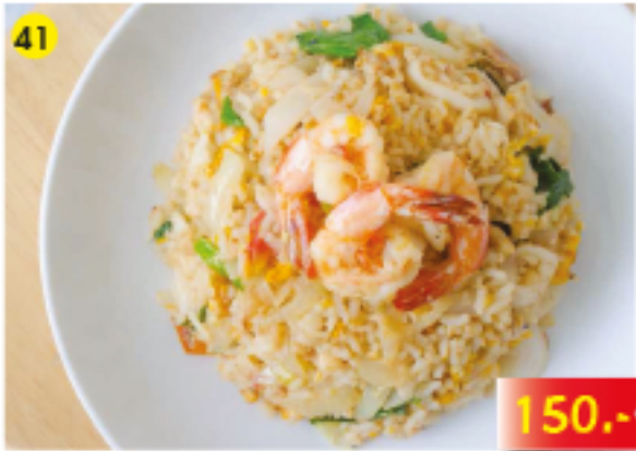
41 ข้าวผัดซีฟู้ด Kau Phad : Fried Rice with Seafood Gebratener Reis mit Meeresfrüchten 150.-