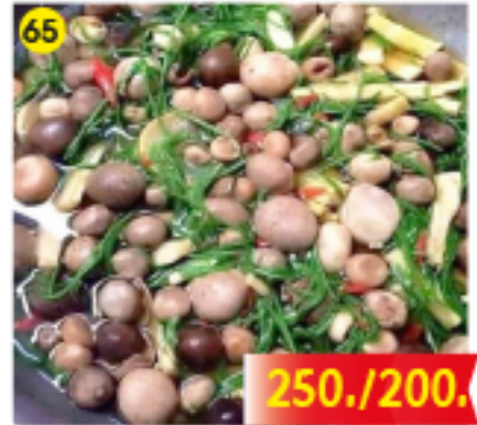
65 แกงเห็ดเผาะ/เห็ดรวม Spicy Thai Mushroom Soup Thailändische Pilzsuppe