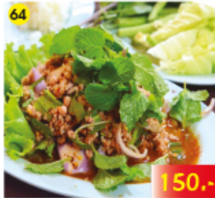
64 ลาบไก่ / หมู "Laab" Chicken or Pork "Laab" Gebratenes Huhn oder Schweinehack, Thai-style, Scharf