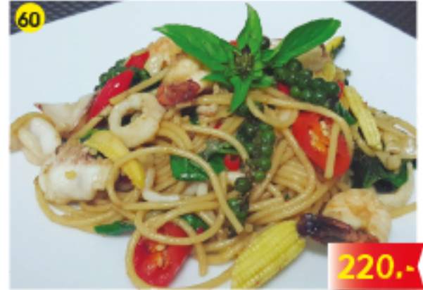
60 สปาเก็ตตี้ซีเม่าซิวฟู้ด Spaghetti Seafood "Kee Mau", Spicy Spaghetti oder Penne mit Meeresfrüchten