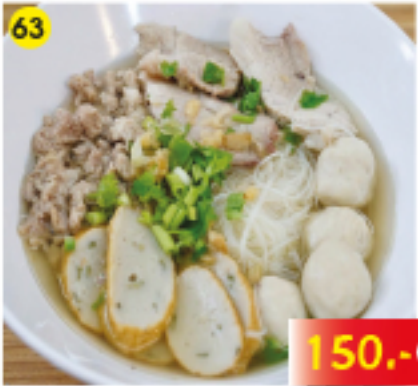
63 ต้มยำเต๋ยวไทยทุกองไตล้ Thai Noodle Soup any Style Thai Nudelsuppe, breite oder schmale Nudeln, Schwein oder Hühnerfleisch