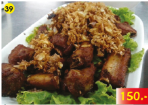
39 ซี่โครงหมูในกระเทียมและพริกไทย Pork Ribs in Garlic and Pepper Gebratene Schweinerippchen in Knoblauch und Pfeffer 150.-