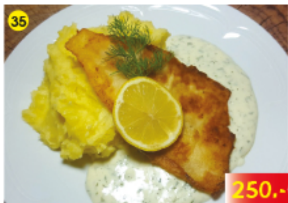
ปลากระพงทอดมันฝรั่ง Fried Fish Filet with Mashed Potatoes Gebratenes Fischfilet mit Kartoffelpüree