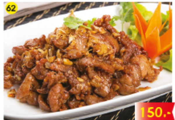
62 หมู / ไก่ / เนื้อ กระเทียมและพริกไทย Pork, Chicken or Beef in Garlic and Pepper Schweinefleisch, Hühnchen oder Rindfleisch in Knoblauch und Pfeffer