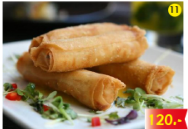
ปอเปี๊ยะทอด Spring Rolls Frühlingsrollen