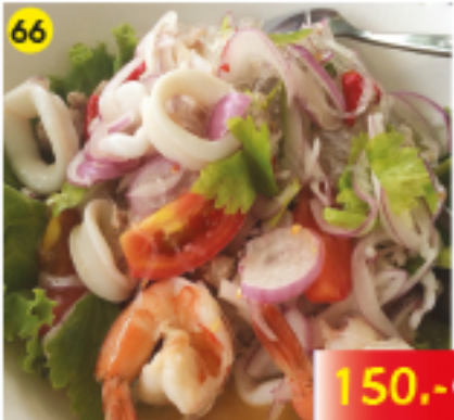
66 ยำซีฟู้ด Yum Thalee or Yum Plaa Spicy Seafood or Fish Salad Scharf angemachter Thai-Salat mit Meeresfrüchten oder gebratenem Fisch