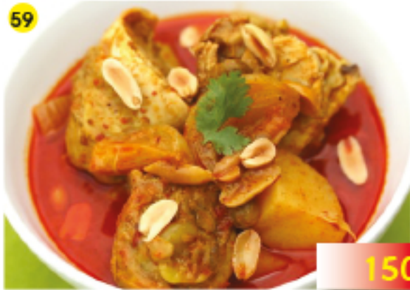
59 มัสมันไก่ "Massaman" Curry with Chicken "Massaman" Curry mit Huhn