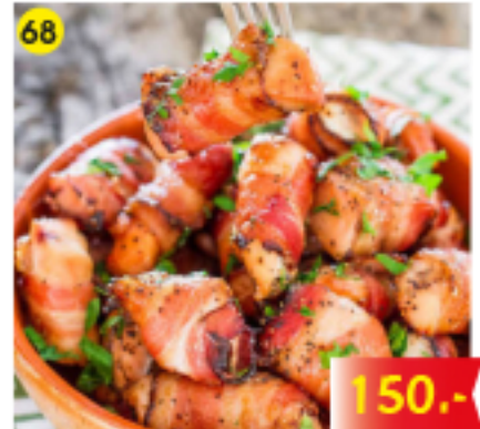
68 ไก่พันแนบคอน/ไ้ถ่กรอก Bacon-Wrapped Chicken Mit Speck umwickeltes Huhn