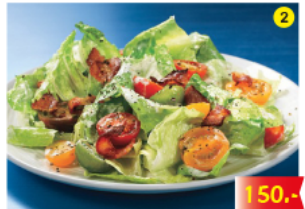
เบคอน มะเขือเทศ ผักสลัด Bacon, Tomato, Salad Speck, Tomaten, Salat