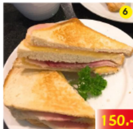
แฮมแอนด์ชีส แซนวิช Ham & Cheese Sandwich Schinken Käse