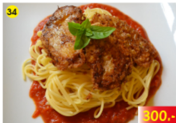
Schnitzel Milan ชีส/มะเขือเทศและปานกัตตอ/หมูสุปแบ่งทอด Schnitzel Milano : Cheese/Tomato&Spaghetti/Pork Cutlet Schnitzel Milano mit Käse und Tomate, Spaghetti als Beilage/Schweinekotelett