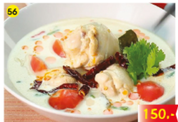
พะเนียงไก่ / หมู Paneng Curry Chicken or Pork Curry "Paneng" mit Huhn oder Schweinefleisch