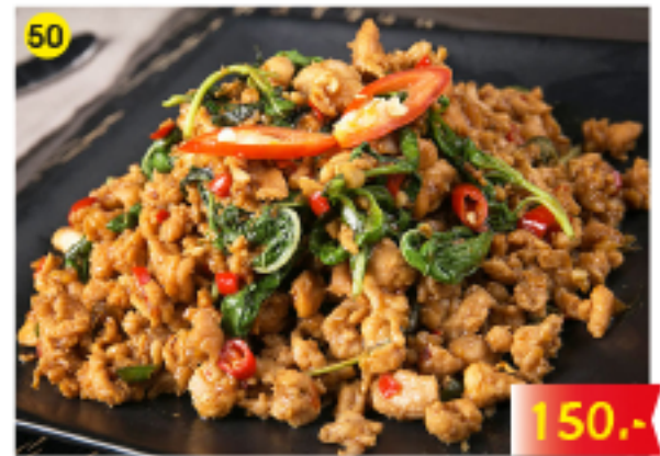
50 ผัดกะเพราไก่ / หมู / เนื้อ Fried Chicken, Pork or Beef with Basil Leaves Gebratenes Huhn, Schwein oder Rindfleisch mit frischen Basilikum