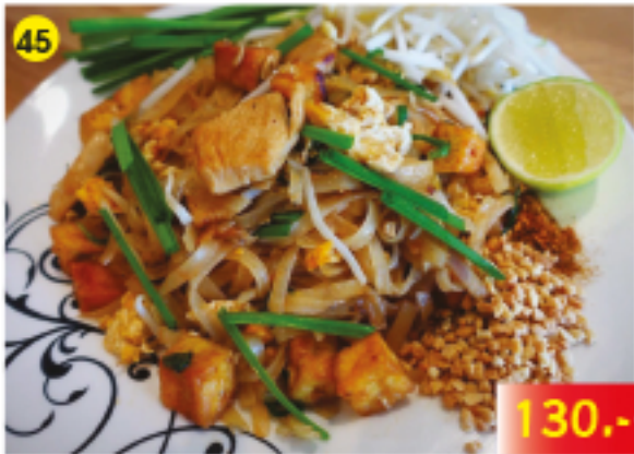
45 ผัดไทยไก่ Pad Thai : Fried Noodles with Chicken Gebratene Nudeln mit Huhn