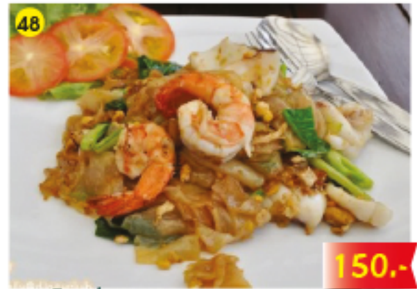
48 ผัดซีอิ้วซีฟู้ด Pad Siyu : Fried Noodles with Seafood Pad Siyu : Gebratene breite Nudeln mit Meeresfrüchten