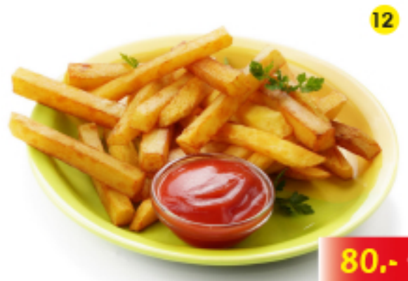
เฟรนช์ฟราย French Fries Pommes Frites