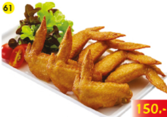
61 ปีกไก่ทอดกระเทียมและพริกไทย Fried Chicken Wings Gebratene Hühnerflügel in Knoblauch und Pfeffer