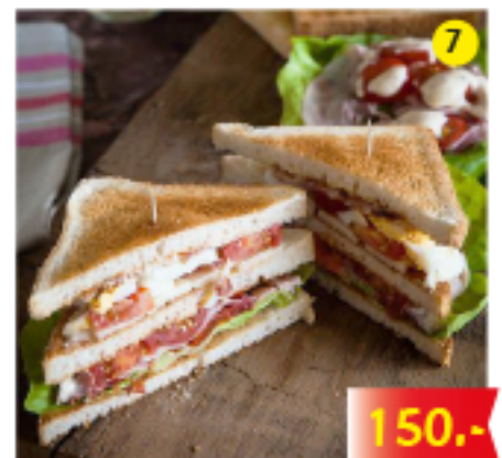
คลับแซนวิช Club Sandwich Club Sandwich