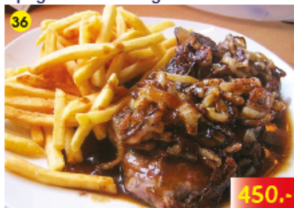
เนื้อเด็ก 300gr. กับหัวหอม มันฝรั่งทอด Beef Steak 300gr. with Onions&French Fries Rindersteak 300gr. mit Zwiebeln&Pommes