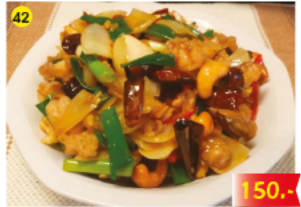
42 ไก่ผัดเม็ดมะม่วงหิมพานต์ Fried Chicken with Cashew Nuts Gebratenes Hähnchen mit Cashewnüssen 150.-