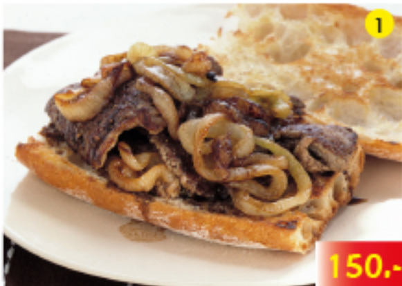
เนื้อสเต็กกับหอมหัวใหญ่ Steak and Onions Steak mit Zwiebeln